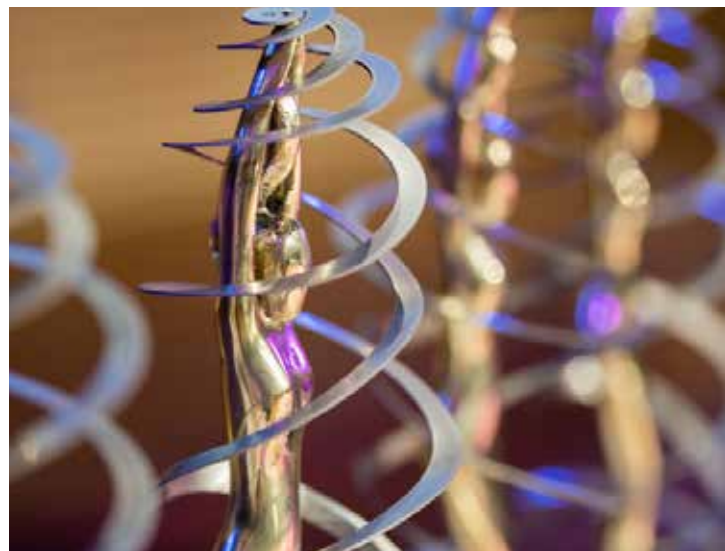
Vorsorgepreis (Hygieia), Bildnachweis: Klaus Ranger

Eingereicht wurden verschiedene Projekte, die sich mit Gesundheitsförderung und Prävention befassen. Die Bandbreite reichte dabei von kreativen Einzelaktionen bis hin zu dauerhaften Projekten und Kampagnen. In den vergangenen 10 Jahren wurden mehr als 1.600 Projekte aus ganz Österreich für den Vorsorgepreis eingereicht und die 54 besten Projekte wurden mit dem Vorsorgepreis ausgezeichnet.